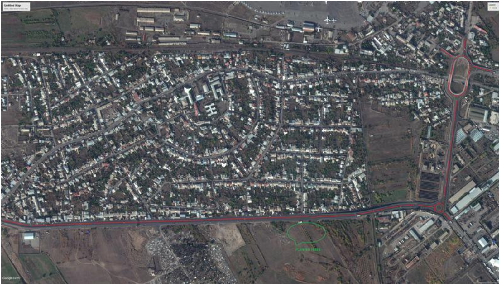
Պատկեր 2: Մրցույթ 2-ի շրջանակներում տնկված ծառերի տեղադիրքի քարտեզ